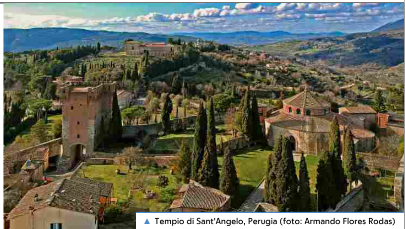
▲ Tempio di Sant'Angelo, Perugia