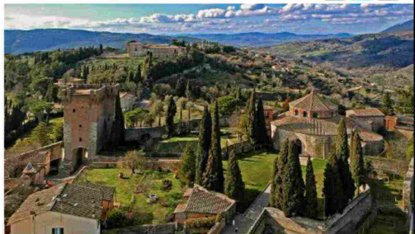
Tempio di Sant'Angelo, Perugia