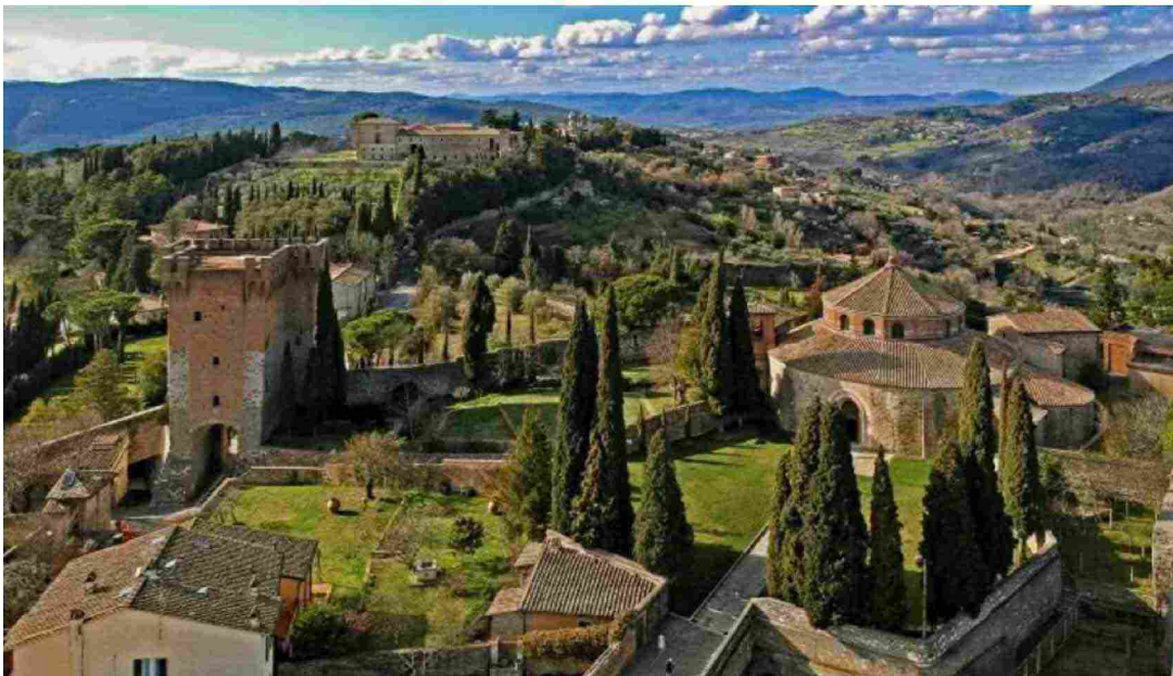
Tempio di Sant'Angelo, Perugia