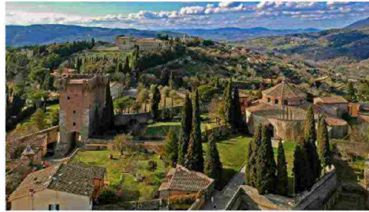
Tempio di Sant'Angelo, Perugia