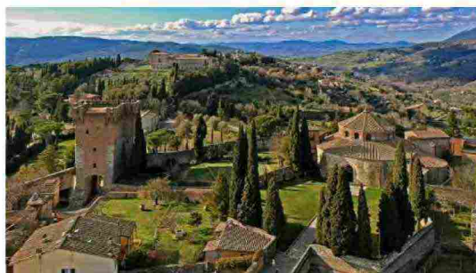
Tempio di Sant'Angelo, Perugia